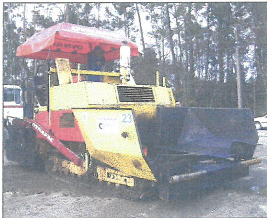
VISTA GENERAL DEL EQUIPO